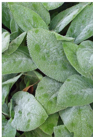
Stachys byzantina 'Big Ears'