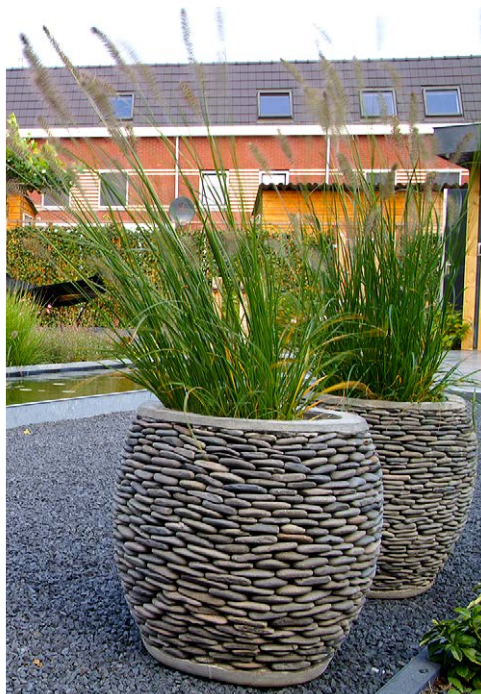
In de fraaie kiezelpotten staat lampenpoetsergras.

in de winter is de beplanting hier nog de moeite waard; enkele taxusbollen en het wintergroene zwenkgras Festuca gautieri combineren dan mooi met de beige tinten van de siergrassen. De weelderige border ligt vrij centraal in de tuin waardoor deze goed zichtbaar is vanaf de beide terrassen én vanuit de woning. Pal naast de border ligt de 12 m lange, strakke vijver, die iets hoger ligt dan het hoofdterras van natuursteen (Bluestone) en het aangrenzende vlak basaltplaat. Klaas van Elsäcker: „Ik vind het belangrijk dat de vijver als een spiegel bovenop de tuin ligt. Daarom