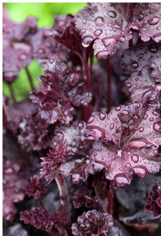
Heuchera micrantha 'Palace Purple'